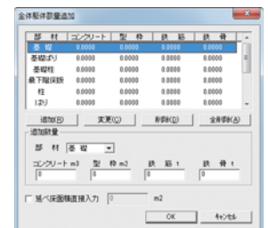
図3 全体躯体数量追加