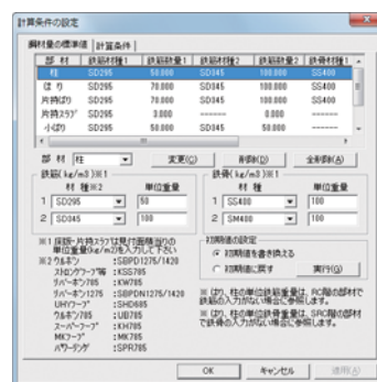
図2 計算条件の設定(鋼材量の標準値)